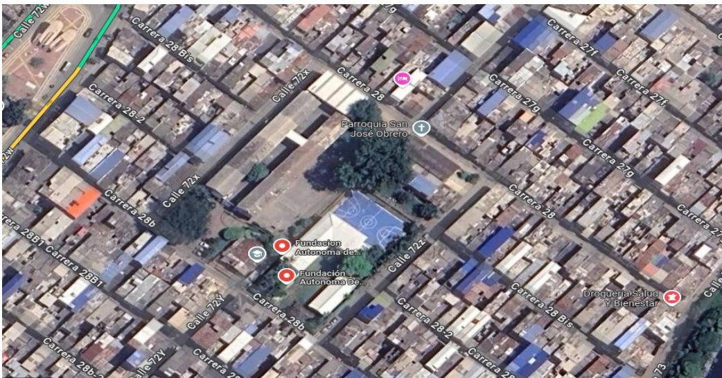
Ilustración 1: Ubicación de la fundación Fundautónoma

En cuanto a los ingresos de la fundación, según informes de Fundautónoma (2023) su capital financiero está compuesto en un 70% por los aportes de la universidad autónoma de occidente (UAO) y el otro 30% corresponde a donaciones recibidas por diferentes empresas, entidades, y organizaciones que se han vinculado con la fundación en su propósito de servir a las comunidades vulnerables de Cali. Desde el punto de vista financiero este modelo le brinda a Fundautónoma la capacidad de mantener una estructura que gire en torno al desarrollo de su misión, debido a que cada recurso que ingrese a la fundación es utilizado para trabajar en el desarrollo de los objetivos, y por ende, se responde a las demandas de las comunidad con respecto a sus necesidades, además se amplía el impacto social y se incrementa la cobertura en la región hacia las comunidades más afectadas por la diferencia socioeconómica en la que se encuentran actualmente.