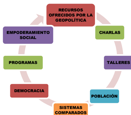
Figura 1: Modelo de gestión cimentado en la geopolítica como herramienta para el impulso de la democracia

A continuación, en la figura 1 se presenta un modelo de gestión como aporte final. Tal y como puede observarse, se propone utilizar recursos didácticos, mediante charlas, talleres, exponiendo sus bondades a la población en cada país para explicar la forma según la cual la geopolítica influye en la democracia, creando así programas los cuales brinden herramientas transformadoras conducentes al verdadero empoderamiento social, priorizando su desarrollo nacional.