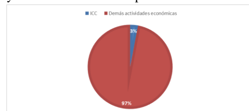
Figura 2. Participación de Industrias creativas y culturales en el municipio

En el ámbito local de Aguachica-Cesar, las ICC representan el 3% de las empresas registradas en la cámara de comercio, lo que proporciona una perspectiva sobre la dinámica económica y los potenciales campos de acción