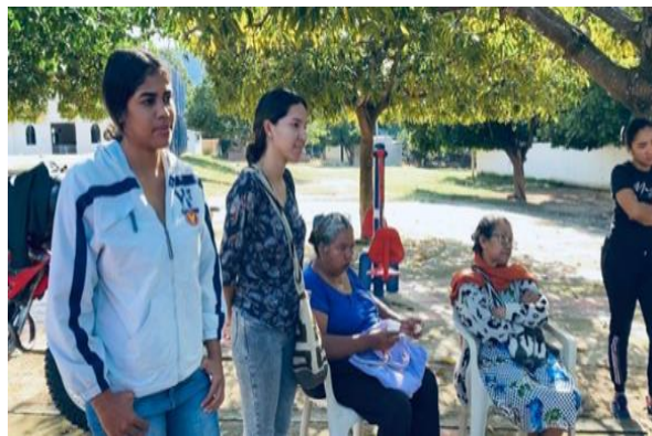
Reuniones En la Plaza

A partir de esta organización temática se pudieron identificar coincidencias entre los testimonios de jóvenes y adultos. Ambos grupos expresaron la necesidad de rescatar los valores comunitarios y de crear espacios para el aprendizaje colectivo. Las conversaciones derivaron en propuestas concretas, como reactivar los talleres de tejido, fortalecer la enseñanza de la lengua kankuama y promover actividades artísticas que mezclen la tradición con expresiones juveniles contemporáneas.