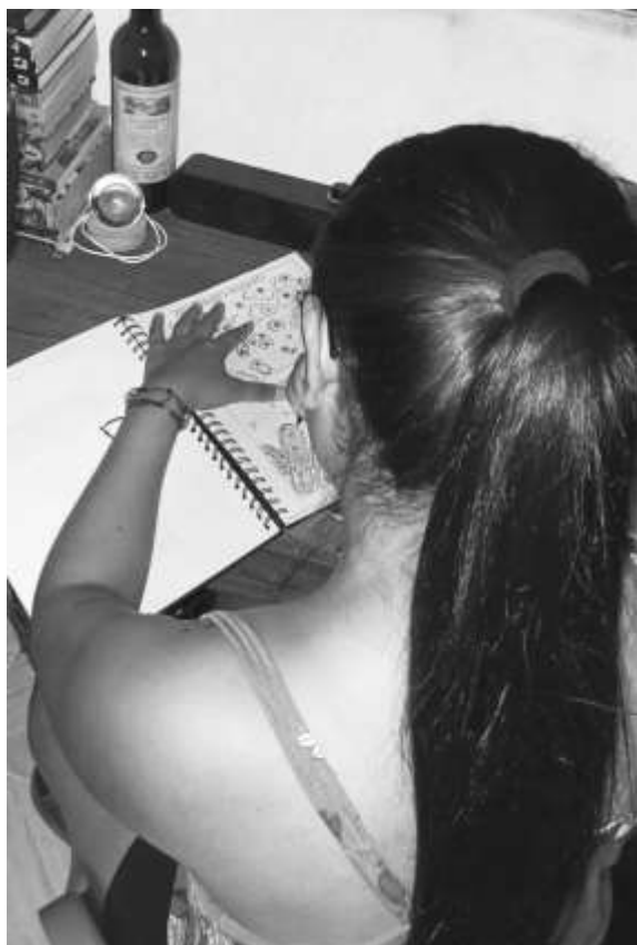
Ilustración 3 Elaboración de ilustraciones