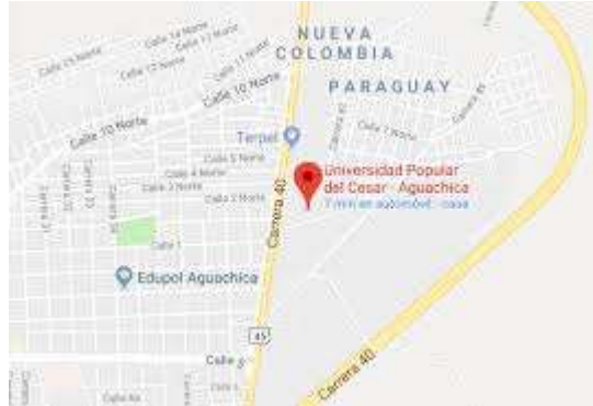
Ilustración 1 Ubicación de la Universidad Popular del Cesar