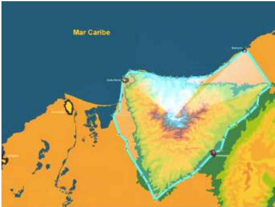
Mapa 1. “Línea Negra”, límite sagrado de La Sierra Nevada de Santa Marta.

A pesar de las reivindicaciones logradas en materia de derechos étnicos desde acumulados históricos que en el orden político, reúnen y son fruto del descontento popular, inducido por un modelo de despojo que se impone en un conflicto social y armado que, a su vez materializa la oposición que surge con la lucha de clases haciendo legítimo el uso de la protesta y la movilización como campo de campo urbano y rural, con el desarrollo de múltiples escenarios de contradicción y tensiones, donde se distinguen las apuestas programáticas en materia de derechos sociales, políticos, económicos y culturales. Vía de hecho que cabe resaltar en el caso de Colombia, al ser determinante para disputar los espacios de interlocución y negociación en términos de participación y representación social y democrática, con los distintos gobiernos de turno desde la segunda mitad del siglo XX hasta la fecha. Dado al incumplimiento de los acuerdos respectivos a la expansión de los resguardos con base en el territorio ancestral que no ha sido reconocido ni distribuido según los