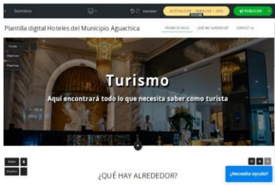
Ilustración 3 Sección de actividades en el sitio propuesto