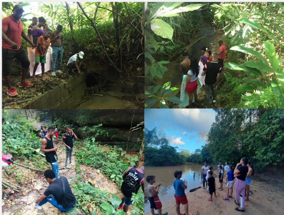
Ilustración 2. Reconociendo los recursos naturales de nuestra región

integrales con capacidades ambientales, asegurando que los participantes fomenten de correcta manera lo aprendido en la investigación.