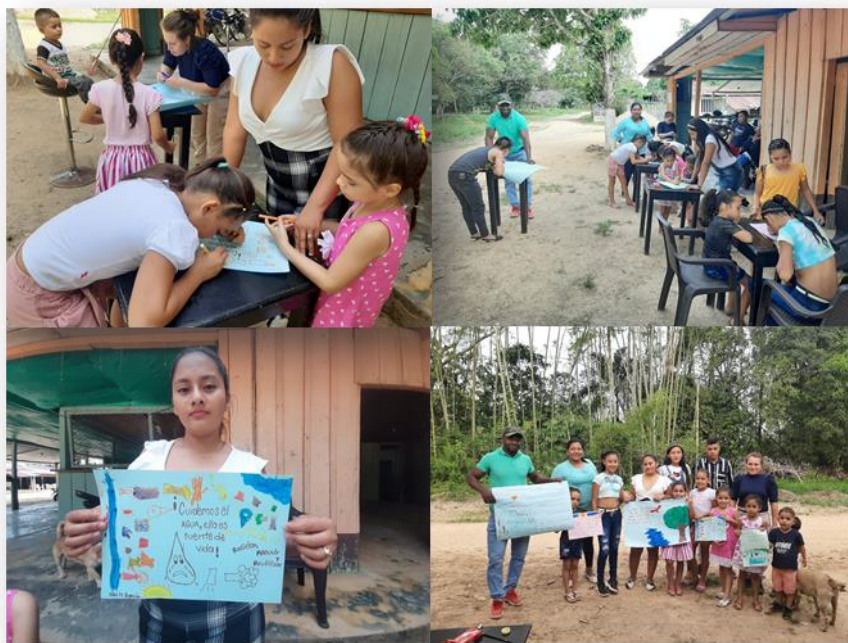
Ilustración 1. Unificando criterios para la representación artística del conocimiento ambiental

De igual forma, se establecieron metas a cumplir como compromisos con los participantes, donde se basaron principalmente en la unificación y la ampliación de la participación de los pobladores locales, vinculado de manera acertada a todas las personas, que se benefician de los recursos naturales, para que estos puedan entender su importancia y los cuidados que deben tener para su conservación. De igual forma, repetir las estrategias con futuras generaciones garantizando la transmisión de conocimientos como de actitudes ambientales, formando ciudadanos integrales con capacidades ambientales, asegurando que los participantes fomenten de correcta manera lo aprendido en la investigación.