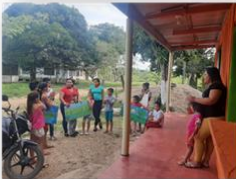
Ilustración 8. Divulgación y proyección social, de las acciones realizadas desde la institución educativa