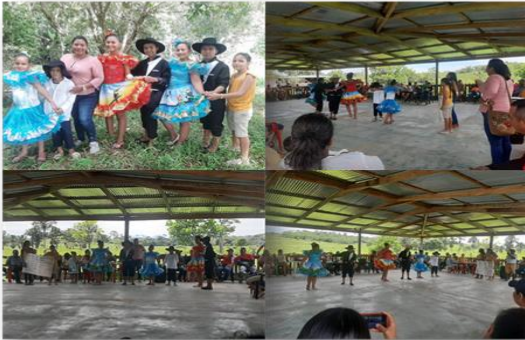
Ilustración 7. Demostración de danzas ambientales ante comunidad educativa el Rubí, para la conservación de la biodiversidad y el desarrollo sostenible de la región.