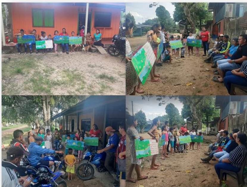
Ilustración 4. Promoción de valores ambientales para la conservación de la Biodiversidad y el desarrollo sostenible

4.4 Desarrollar y poner en práctica, con los estudiantes del centro educativo El Rubí, Municipio de la Macarena, Meta, una estrategia didáctica, fundamentada en “las danzas ambientales”, como mecanismo, que permita, llamar la atención, sobre el cuidado y la preservación de los recursos naturales.