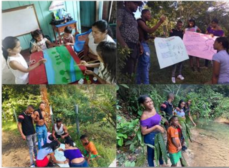
Ilustración 6. Formación y sensibilización ambiental en zonas rurales a través de tradiciones orales y el folclor.

4.5 Promover, con los estudiantes del centro educativo El Rubí, Municipio de la Macarena, Meta, la importancia de la preservación de los recursos naturales y los valores ecológicos que fomenta, la conservación de la ancestralidad y el medio ambiente.