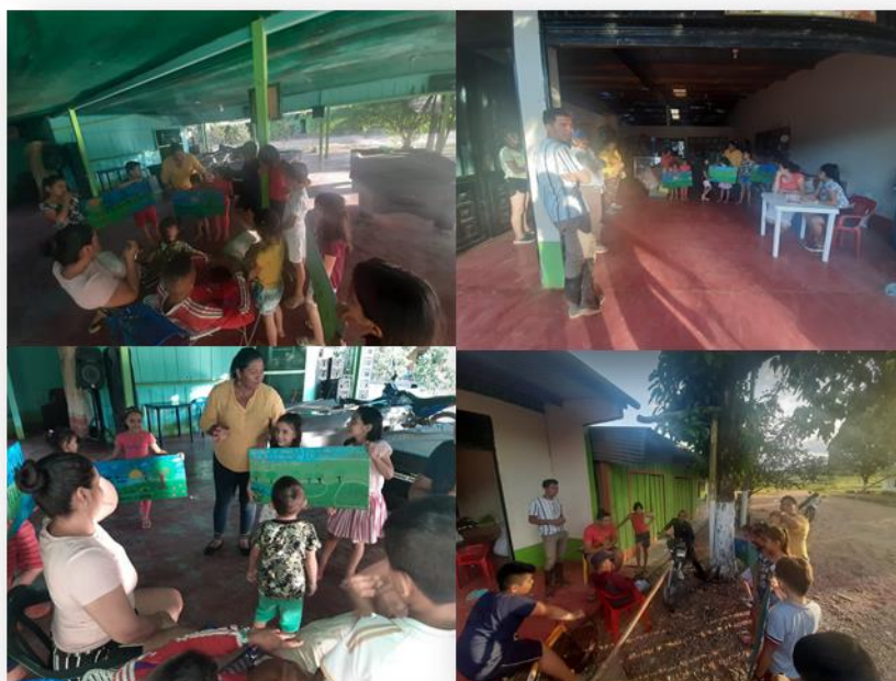
Ilustración 3. Acciones didácticas para la sensibilización ambiental efectiva

Posteriormente, se establecieron compromisos y metas a cumplir, de las cuales se encontraba la continuidad de los procesos implementando, vinculando cada vez más la participación de personas aledañas de la región, para magnificar los conocimientos y experiencias adquiridas al largo del desarrollo de la misma. De igual forma, repetir las estrategias con futuras generaciones garantizando la transmisión de conocimientos como de actitudes ambientales, formando ciudadanos integrales con capacidades ambientales, asegurando que los participantes fomenten de correcta manera lo aprendido en la investigación.