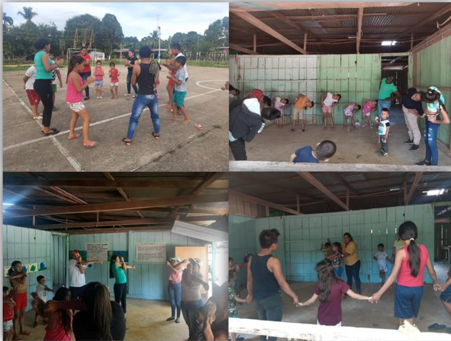
Ilustración 5. Preparación y creación de pasos coreográficos de danzas Ambientales como estrategia didáctica lúdico-pedagógica