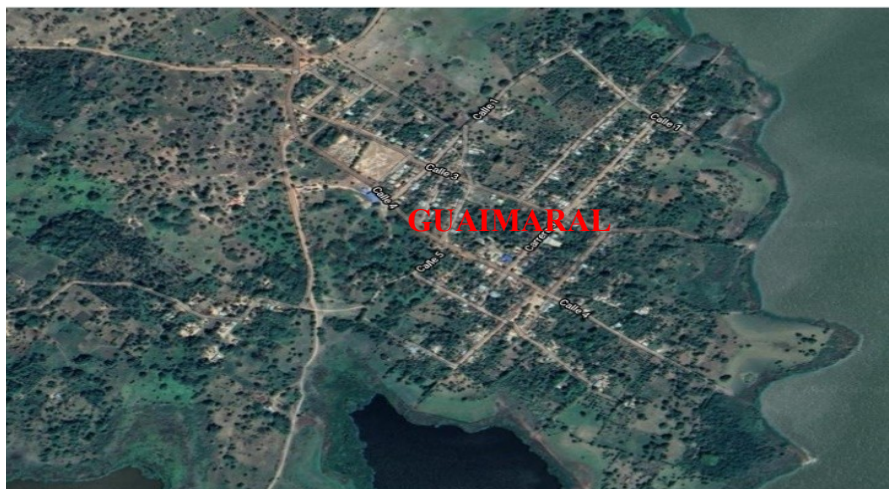
Figura 2. Ubicación geográfica del Corregimiento de Guaimaral Magdalena.