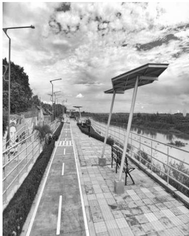
(Figura 1. Malecón en la cabecera).