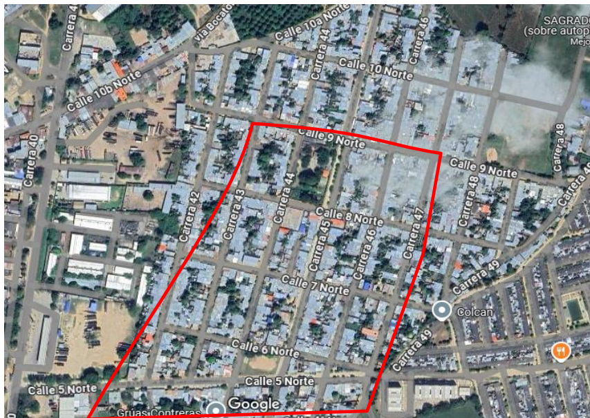
Nota 1, Tomado de Google Maps

El barrio Nueva Colombia está ubicado en la zona nororiental de Aguachica, Cesar, y cuenta con una población de casi 30 mil habitantes. Se extiende desde la carrera 40 hasta la carrera 47, y desde la calle 5 Norte hasta la calle 9 Norte (tal como se muestra en la figura del mapa social). Limita con los barrios Tierra Linda, Villa Paraguay, Villa Horizonte y Villa Sol.