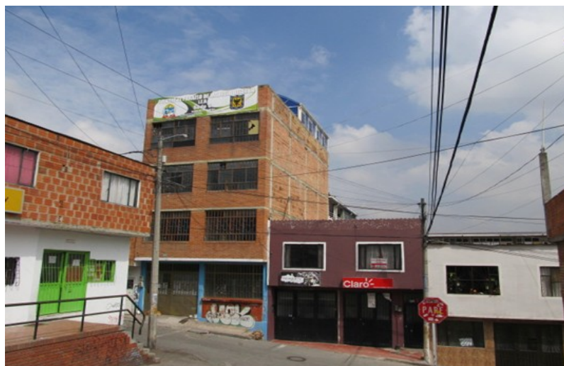
Figura 5. Sede C: Ubicada en la carrera 46 A sur con la calle 73 B sur, a una altura de 2750 msnm, localizada en el sector de El Tanque Laguna.