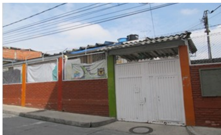
Figura 4. Sede B: Ubicada en la carrera 46 A con calle 71 sur, a una altura de 2700 msnm, en el Barrio Manuela Beltrán.

Obtenido: de esta investigacion 2020-2021