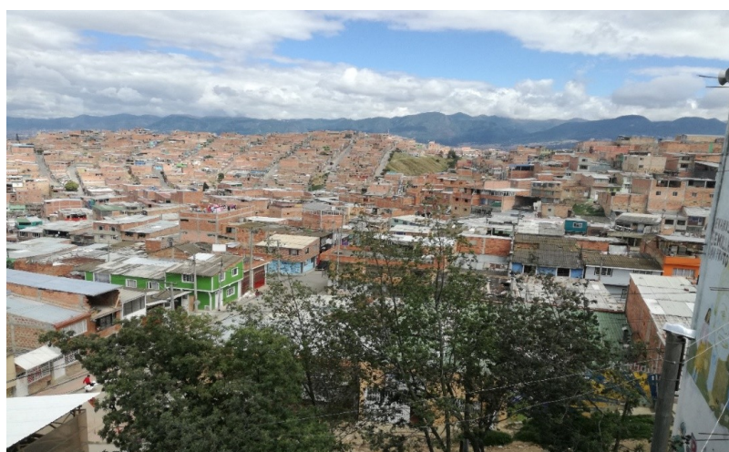
Figura 1. Ciudad Bolivar, Bogotá.

3.1.1.2 Descripción histórica. Aproximadamente en el año de 1940 comienza un proceso de parcelación de sitios y haciendas que rodeaban Bogotá como centro urbano, que llevó a conformar los primeros asentamientos subnormales en este territorio, dando origen a barrios como: Meissen, Lucero Bajo, San Francisco, Ismael Perdomo y México que se ubicaron en los lugares bajos y medios, recepcionando un gran número de personas provenientes de distintos lugares del país, en especial del Tolima, Boyacá y Cundinamarca, entre otros, obedeciendo a procesos de emigración ya sea voluntaria o forzada por el conflicto armado. Para la década de 1970 era de aproximadamente 50.000 habitantes. Hoy en día es una de las localidades con más habitantes, pero también con múltiples problemáticas de orden social, cultural, económico y ambiental. Alcaldía Local de Ciudad Bolívar. Conociendo mi localidad. Recuperado de http://www.ciudadbolivar.gov.co/mi-localidad/conociendo-mi-localidad/historia