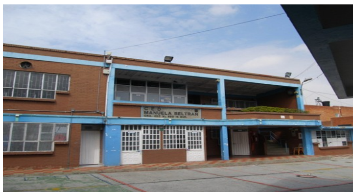
Figura 3. Sede A. Ubicada en la calle 69D sur con carrera 45 C, a una altura de 2.657 m.s.n.m., en el Barrio Manuela Beltrán.

Obtenido: de esta investigacion 2020-2021