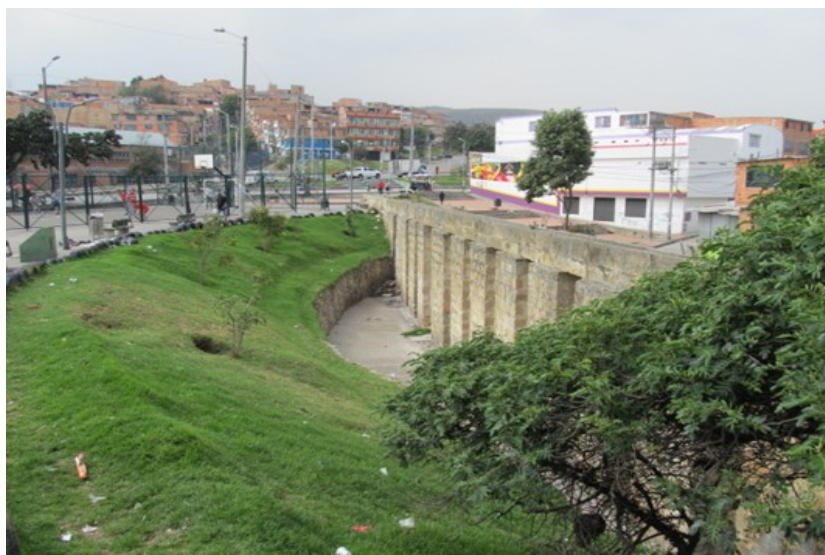
Figura 2. Puente del Indio.

distritales, de la localidad y de la Institución Arborizadora Alta y la presencia de la facultad tecnológica de la Universidad Distrital. Como lugares patrimoniales está el Puente Indio, ubicado muy cerca de la sede C del colegio. (Alcaldía Mayor de Bogotá et al., 2004)