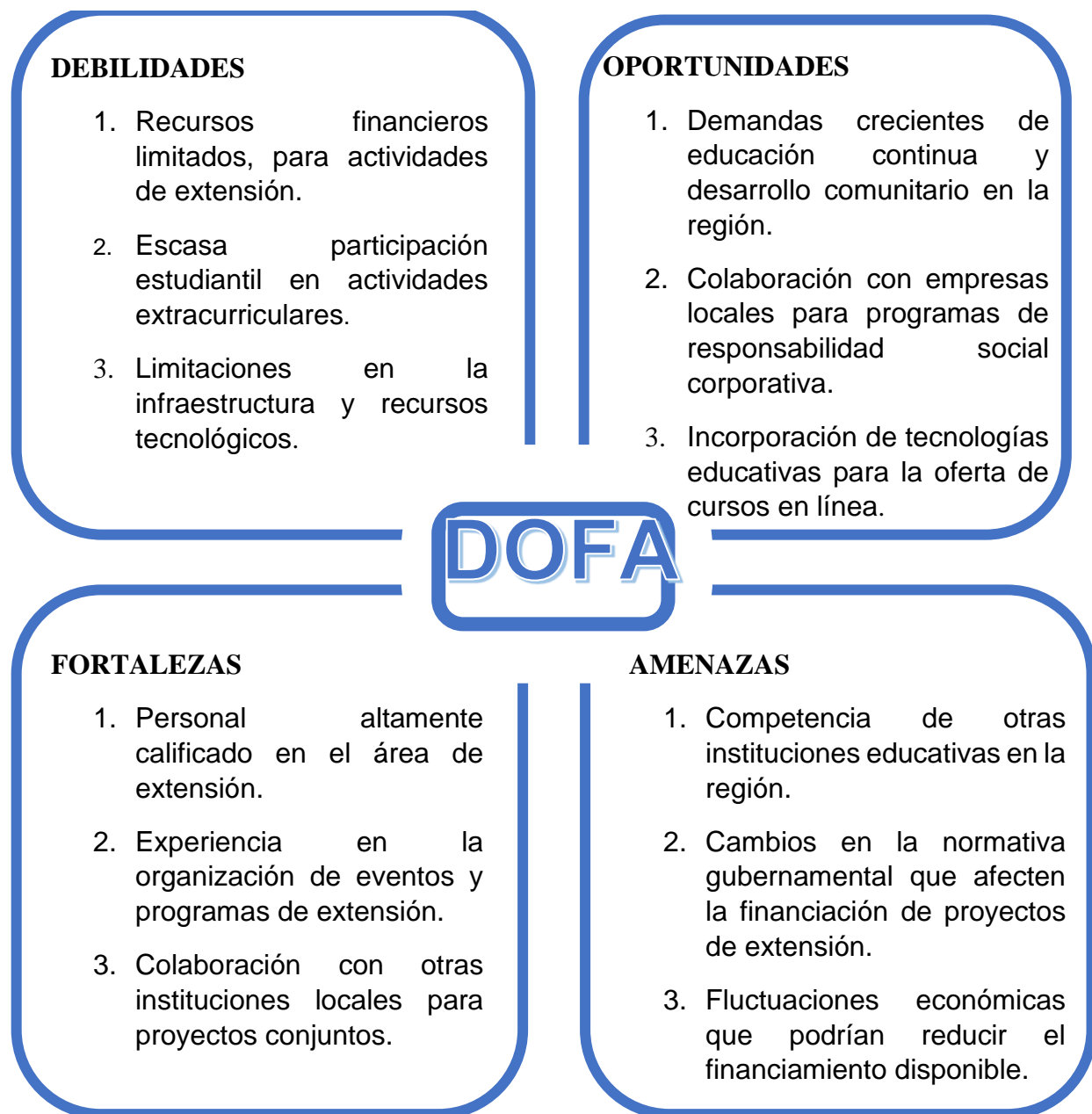
Ilustración 3. Matriz DOFA