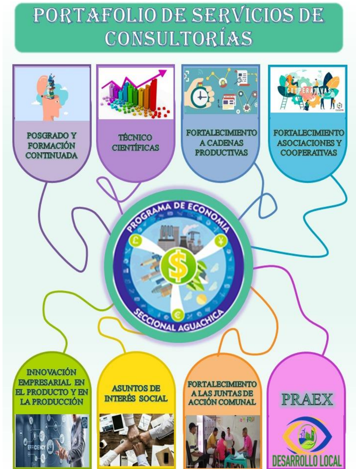
Ilustración 5. Portafolio de Servicios de Consultorías