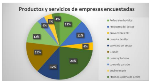
Figura 3. Productos y servicios de las empresas

Un punto relevante a mencionar es el hecho que, la mayoría de empresas u organizaciones que respondieron las encuestas, realizan labores de producción y comercialización de insumos agropecuarios.