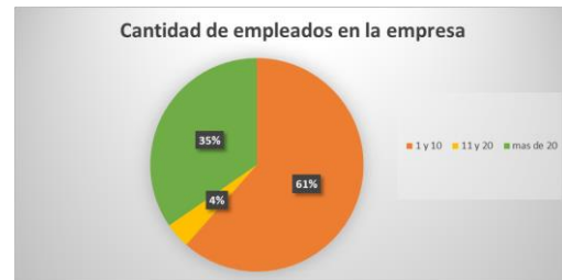
Figura 3. Empleados con los que cuenta la empresa

Un punto relevante a mencionar es el hecho que, la mayoría de empresas u organizaciones que respondieron las encuestas, realizan labores de producción y comercialización de insumos agropecuarios.