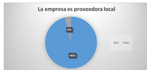
Figura 5. Empresas proveedora local

La figura anterior demuestra que las empresas encuestadas son proveedoras locales en su gran