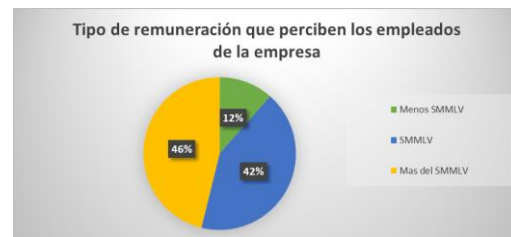
Figura 4. Remuneración que perciben los empleados de la empresa