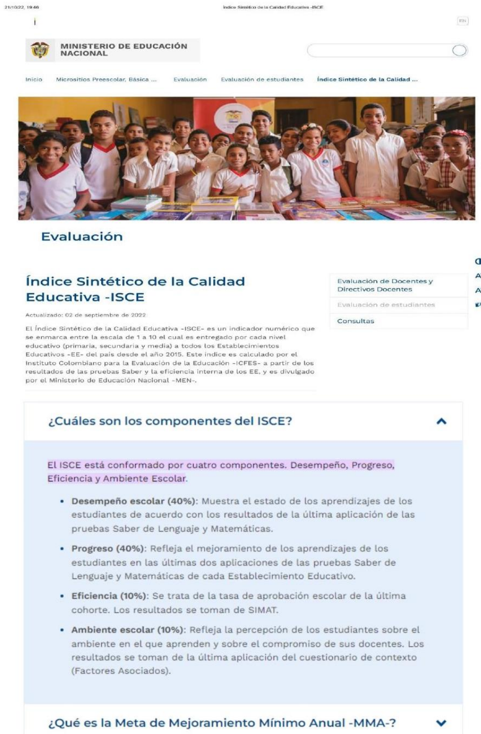
Apéndice 3. Índice Sintético de la Calidad Educativa -ISCE. Ministerio de educación Nacional (2022)