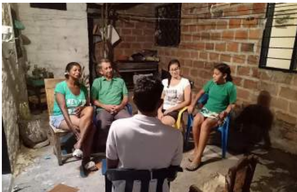
Fotografía 2. Entrevista a familia nuclear realizada el 12 de octubre de 2020.