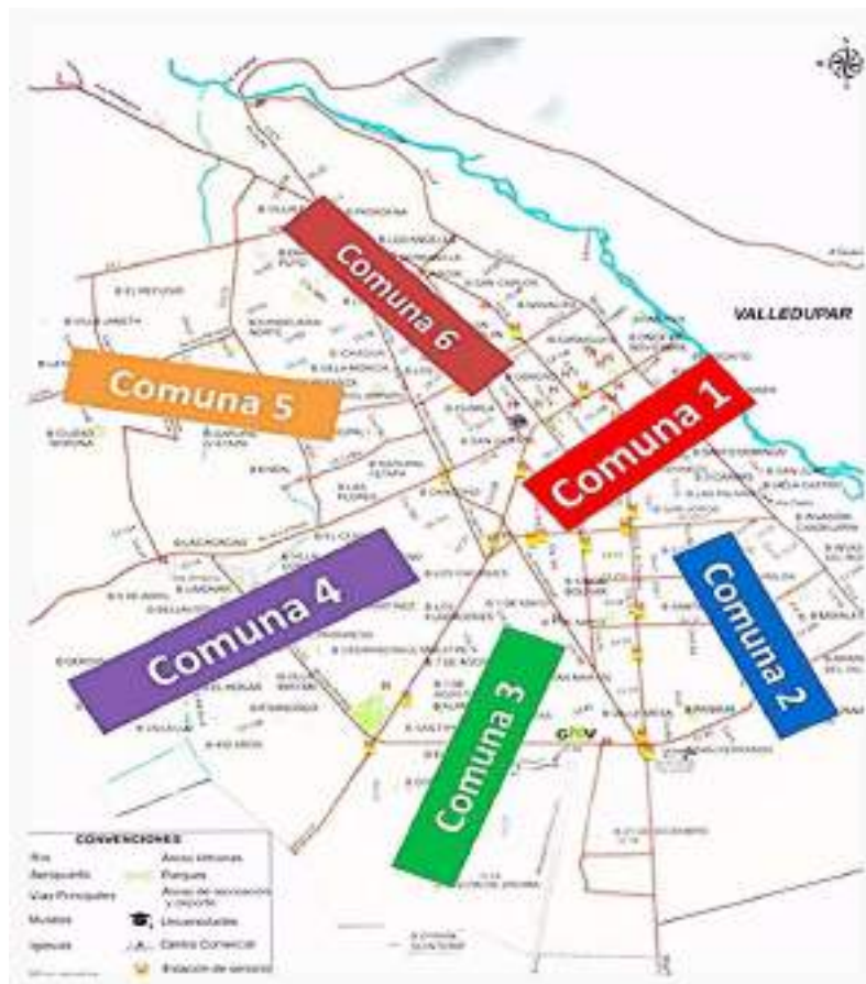
Figura 1. Mapa de Valledupar dividido por comunas.

La delimitación del objeto de estudio es espacial, debido a que la situación se está viviendo y observando en Valledupar, además, la migración venezolana es cada día más recurrente. Así mismo, se ha percibido el ingreso y asentamiento de una población cercana al 37.058 de venezolanos (Migración Colombia, 2020), sin tener en cuenta los que ingresan de manera irregular. Dicha delimitación, tiene como objetivo establecer y una población específica de estudio, en este caso a la comunidad de migrantes venezolanos habitantes en la ciudad en los barrios. Las familias ubicadas se encuentran en los barrios la Victoria y Primero de mayo. El tiempo necesario para desarrollar la investigación, abordaje de población y el espacio empleado para llevar a cabo su desarrollo es de aproximadamente un año.