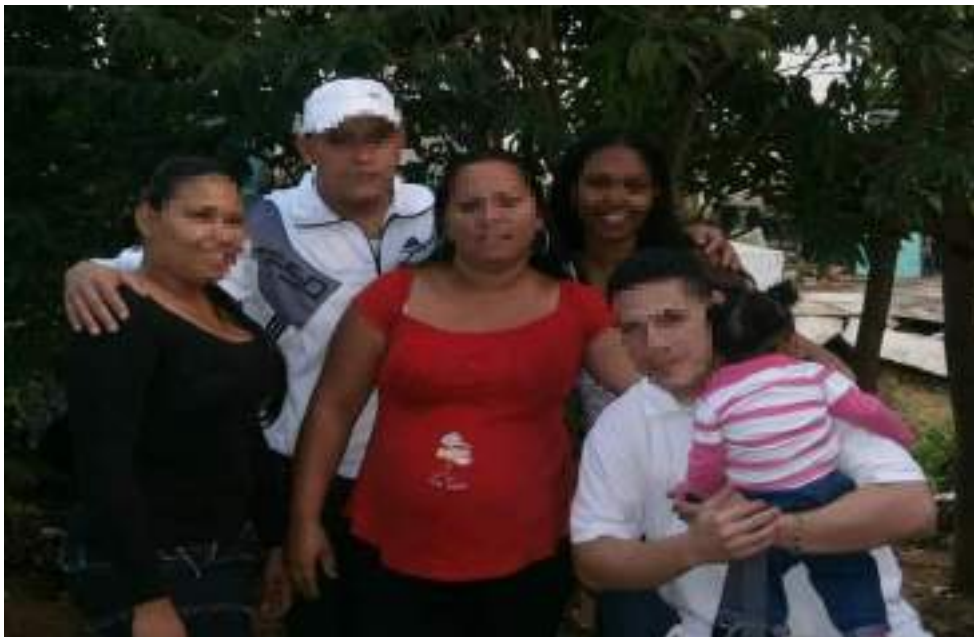
Fotografía 1. Familia del barrio La victoria. Primer acercamiento, el 19 de julio de 2020