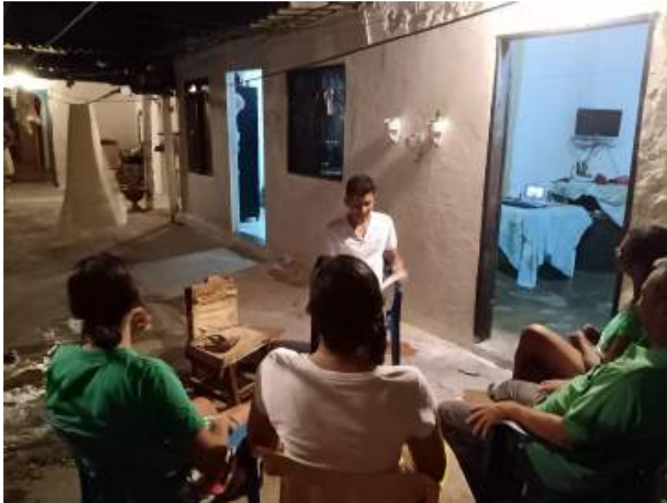
Fotografía 3. Visita a la familia nuclear participante el día 12 de octubre de 2020.