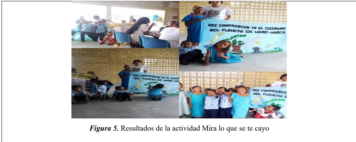
Figura 5. Resultados de la actividad Mira lo que se te cayo

Nota. Elaboración propia (2023) a partir del diario de observación del docente.