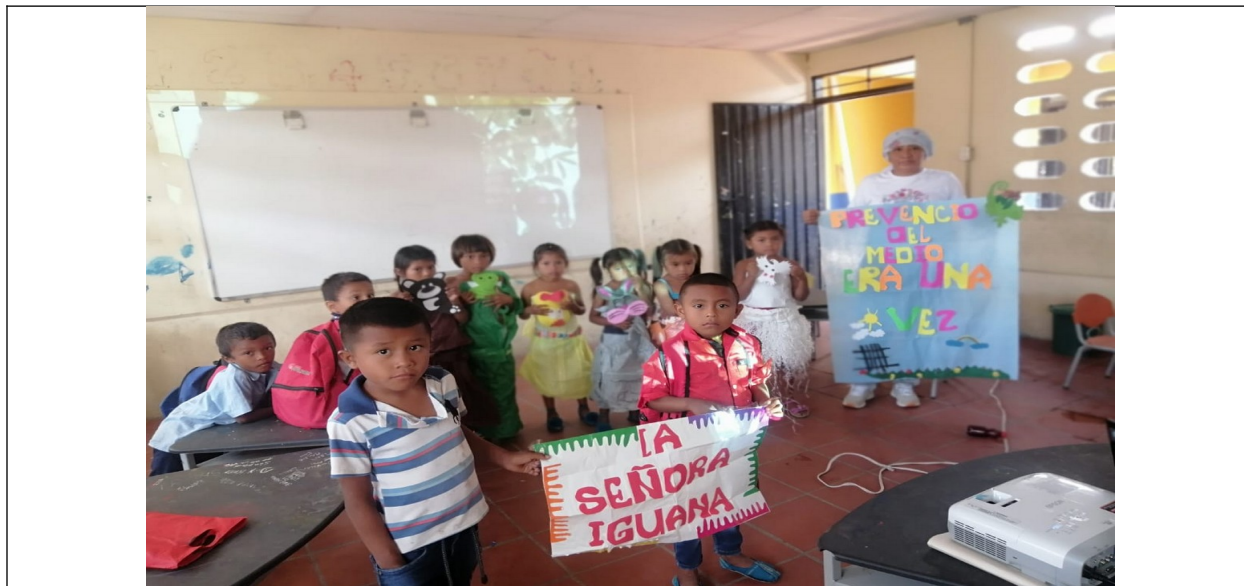
Figura 2. Resultados de la actividad análisis del video Señora Iguana

Nota. Elaboración propia (2023) a través del diario de observación del docente