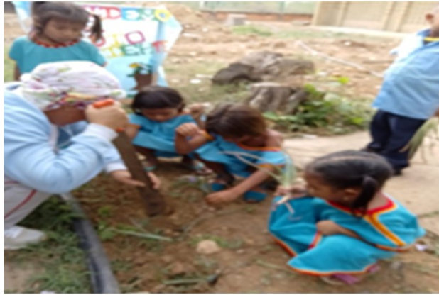
Figura 4. Resultados de la actividad el maquillaje como forma de expresión del amor a la madre tierra

Nota. Elaboración propia (2023) a partir del diario de observación del docente.