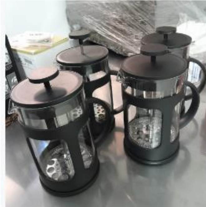
Prensa francesa clasica 800ml P001-3