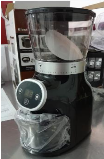
Molino eléctrico tolva 275gr. P487-3