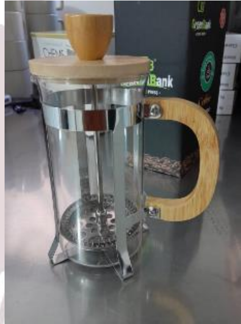
Prensa Francesa Bambú 350ml P- 015