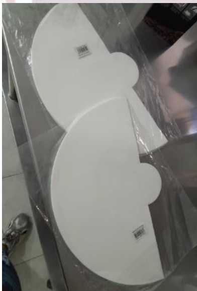
Filtros Chemex de Papel Blanco Original Caja x 100 1-3 Tazas P191-1