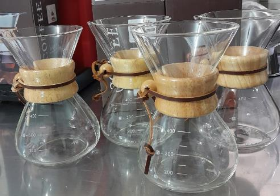
filtro metálico chemex 400 ml