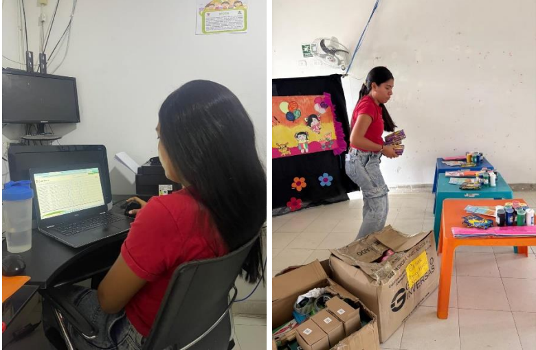
Anexo 1. Fotografías tomadas en evidencia de prácticas.