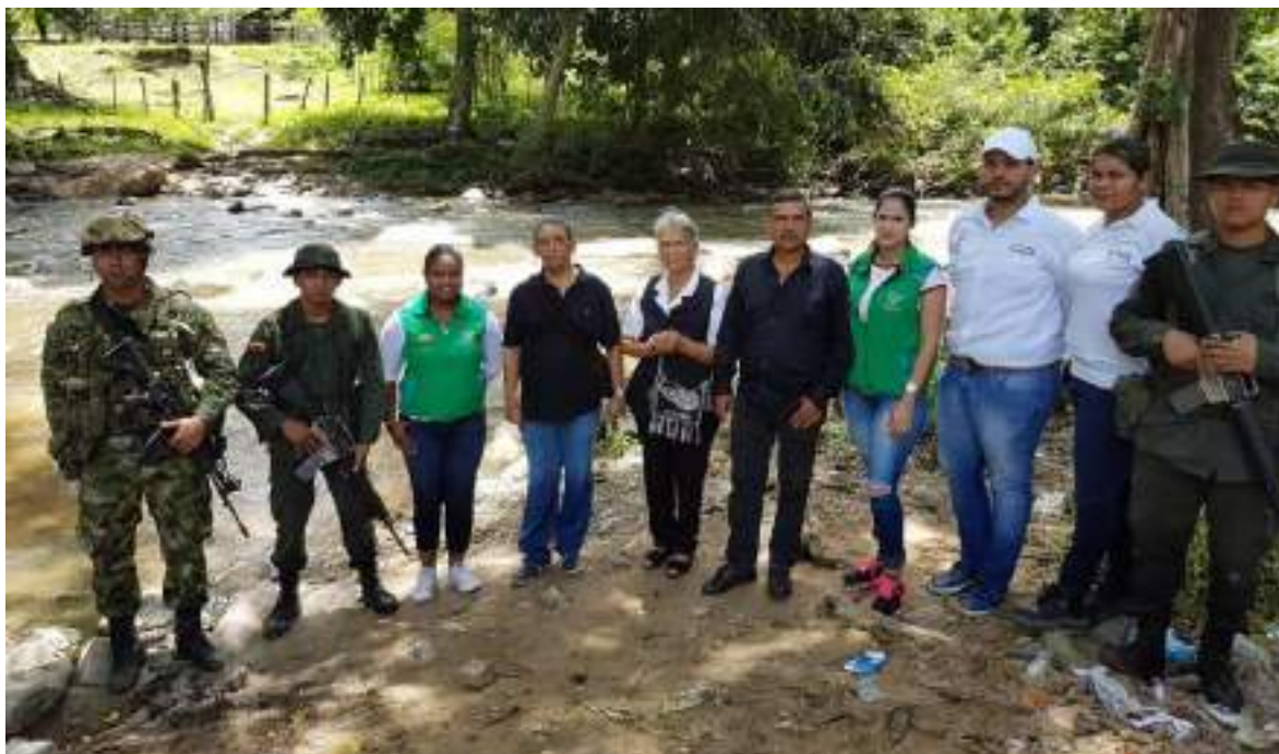
Ilustración 3.[Fotografía de Unidad de Restitución de Tierras]. (San Francisco de Asís. 2017). Archivo Fotográfico de la