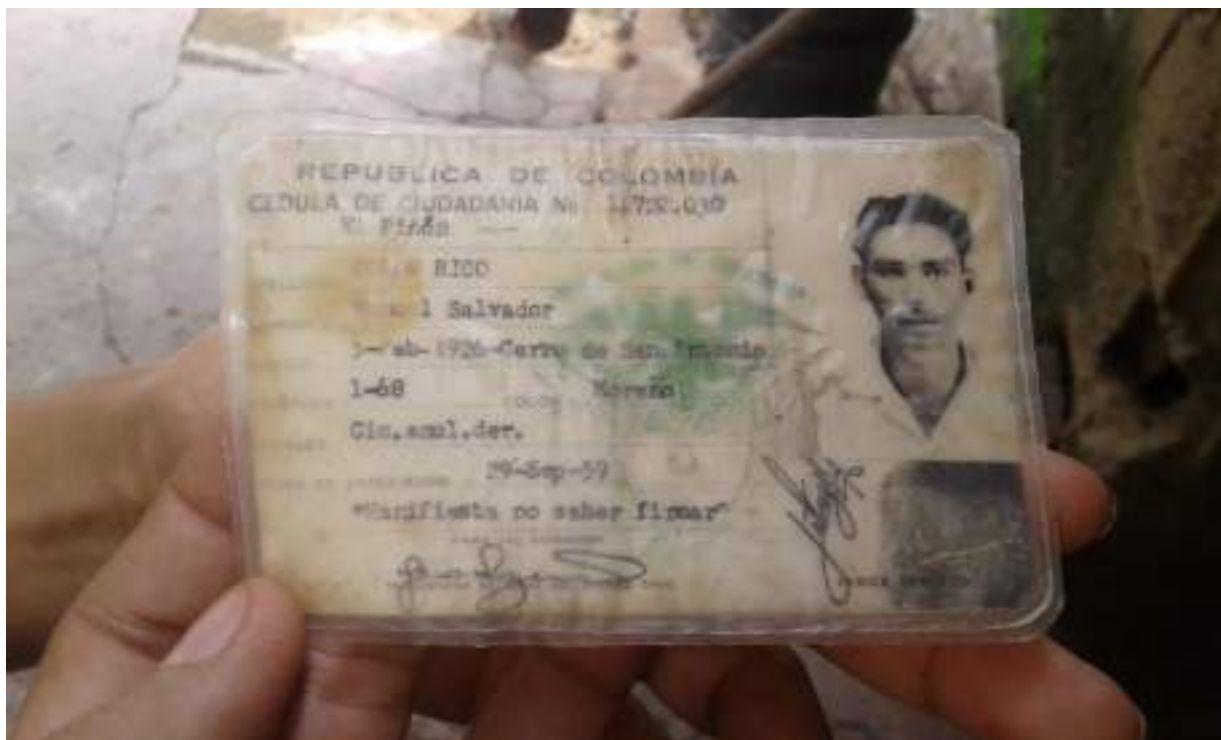
Ilustración 7. en Aguas Blancas Cesar. 09-10-2017.