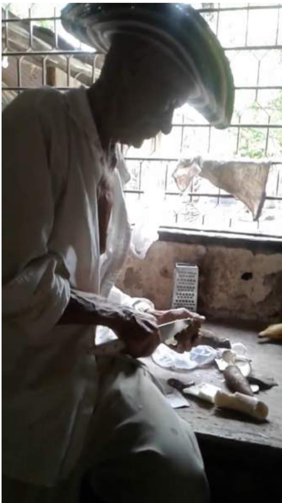
Ilustración 6. en Aguas Blancas Cesar. 22-04-2018