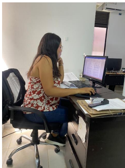
Anexo 1 Realizando los seguimientos por parte de control Interno