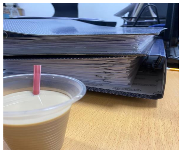
Anexo 4 Realización y Archivo de las órdenes de pago (OP), los informes, los soportes en la respectiva AZ y elaboración de resoluciones.