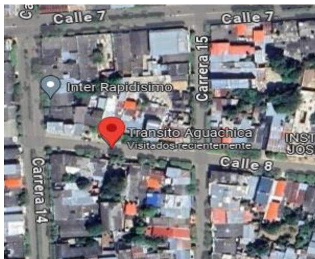
Ilustración 1: Ubicación del Instituto Municipal de Tránsito y Transporte (IMTTA)

El IMTTA se encuentra ubicado en la calle 8 No. 14-46, barrio Olaya Herrera, en el municipio de Aguachica-Cesar, Colombia, identificado con el NIT 800124833-3 bajo la razón social Instituto Municipal de Tránsito y Transporte de Aguachica Cesar. La entidad opera con un total de 19 empleados de planta y 20 contratistas, quienes contribuyen a su manejo eficiente.