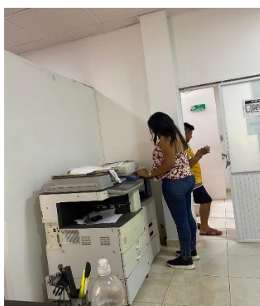
Anexo 2 Fotocopiando y escaneando para subir los comparendos en el semáforo (software del instituto)